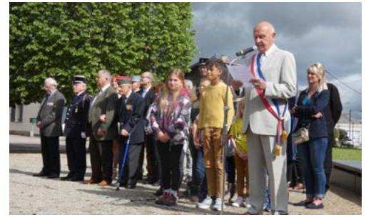
Le 8 mai 2023 a eu lieu la célébration de la libération du 8 mai 1945.