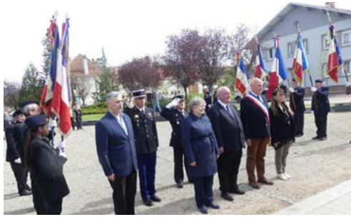
Le 30 avril 2023 a eu lieu la journée nationale du souvenir des victimes et des héros de la déportation.