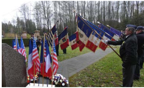
Le 19 novembre 2022 s'est déroulé la cérémonie de la libération de Saulcy.